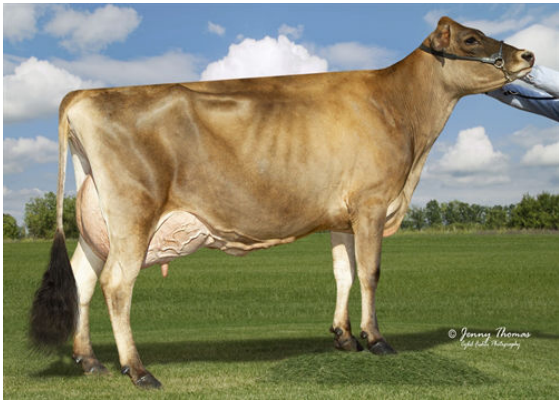
RACHELLES VICEROY LOUISE THIRD DAM